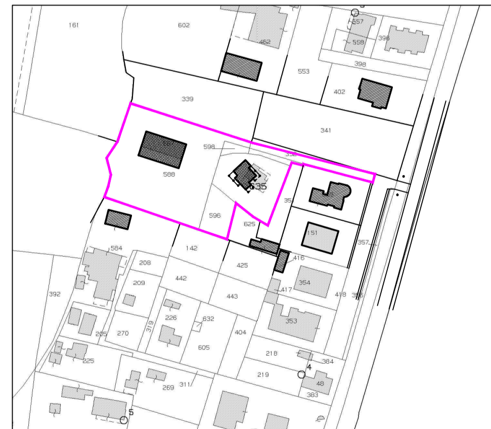
Estratto di Mappa - Scala 1:2000